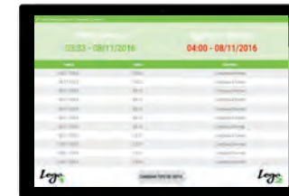
Registro de servicios

Conozca la opinión de sus clientes, con las encuestas de satisfacción por emoticonos.