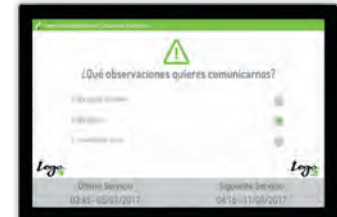
Avisos e Incidencias